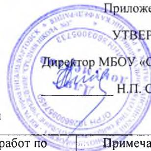
График проведения работ по адаптации